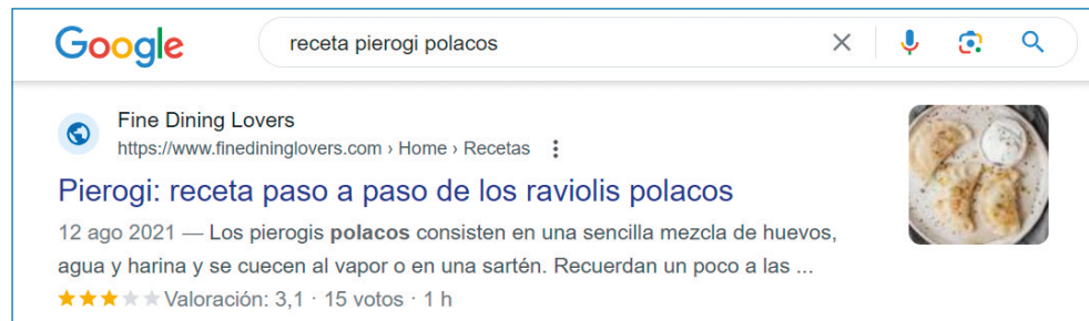
Figura 4.1. Resultado enriquecido para una receta ( pierogi polacos), obtenido gracias al marcado de Schema.org "Recipe".

Uno de los ejemplos de resultados enriquecidos que se dan gracias al marcado de datos estructurados más frecuentes es el de las recetas. En este ejemplo (véase la figura 4.1), al buscar cómo preparar pierogi , las típicas empanadillas de Polonia, podemos ver resultados que muestran una imagen, ingredientes, valoración y el tiempo de preparación. Toda esta información se obtiene gracias al marcado de los datos estructurados en la página, y todo ello ayuda a que Google muestre la receta de una manera más atractiva e intuitiva en sus resultados, lo cual aumenta las posibilidades de que el usuario haga clic. Además, en un contexto como el de las recetas, donde podemos observar que todas las páginas web que se posicionan utilizan datos estructurados, será más difícil competir si nuestra página web no sigue este patrón.